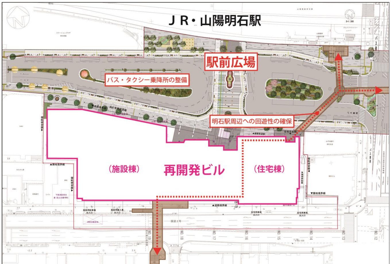
明石駅前広場完成予想図